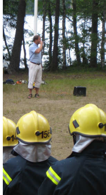
Jade tuo terveisensä leirille.

Myöhemmin päivälle leiriä varjosti ukkoskuuro, mikä kuitenkin päätti lipua leirin ohitse ja vain viskoa vettä pilvien reunoilta. Onneksi näin ☺ Kaiken kaikkiaan avajaiset sujuivat varsin näpsäkästi.