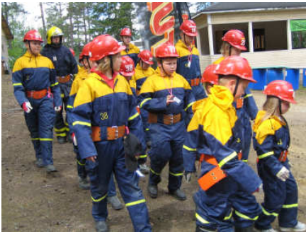
Selänpään VPK:n nuoret järjestäytymässä avajaisia varten.

Leirin viralliset avajaiset pidettiin eilen maanantaina vaihtelevissa sääolosuhteissa: Ensin paistoi aurinko, mutta loppua kohden sade yltyi ja kastele avajaisväen. Hupsista keikkaa, mutta eihän se meitä palokuntalaisia haittaa ☺